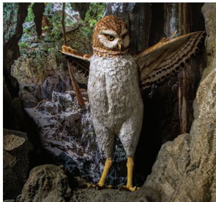
Este es un modelo del Ornimegalonyx , el búho más grande que jamás haya existido. Se piensa que este búho gigante extinto no era capaz de volar.

Algunas de las especies de Cuba exhiben los efectos de la “regla insular”. Esta regla es una hipótesis que propone que, con el tiempo, los animales de la isla tienden a desarrollar cuerpos más pequeños (enanismo) cuando las fuentes alimentarias son limitadas. O, tienden a desarrollar cuerpos más grandes (gigantismo) cuando existe menos presión de parte de los depredadores. Por ejemplo, el búho cubano extinto, Ornimegalonyx , pesaba 17 kilos y es el búho más grande de la historia. Los