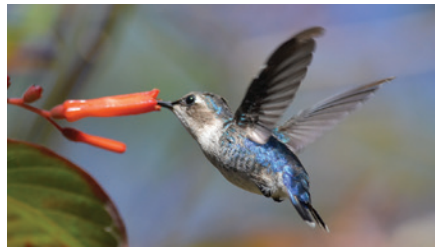
El zunzuncito, el ave más pequeña del mundo, es endémica de Cuba.

Las amenazas medioambientales pueden afectar a muchas especies a la vez. El espacio limitado a menudo hace que los animales de la isla co-evolucionen con otros animales o plantas. Estas especies comienzan a depender unas de otras; juegan un papel importante en sus ciclos de vida. Por ejemplo, en un estudio del zunzuncito, un colibrí endémico de Cuba ( Mellisuga helenae ), esta diminuta ave buscó el néctar de sólo diez especies de flores. Nueve de esas especies de flores eran endémicas de la isla. Con una preferencia tan limitada de alimentos, una disminución en las especies de plantas podría ser un desastre para la población de zunzuncitos.