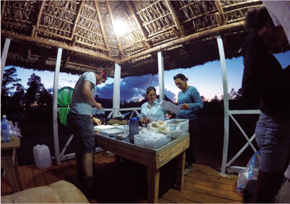
Científicos cubanos y estadounidenses haciendo trabajo de campo en el Parque Nacional Humboldt de Cuba.

con el aumento de los niveles del mar; los cambios en los patrones de las enfermedades; y el incremento de las sequías, las olas de calor y las abundantes lluvias. Las especies de la isla son particularmente susceptibles a los cambios en sus ambientes y, como resultado, tienen un alto riesgo de extinción.