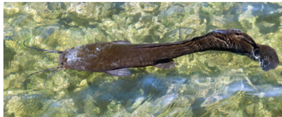
El bagre del norte de África es una amenaza para algunas especies endémicas de Cuba.

Al igual que otros países del Caribe, los ecosistemas de Cuba están cambiando. La fragmentación y la pérdida del hábitat representan riesgos crecientes. El cambio climático también contribuye a la declinación del medio ambiente al contribuir