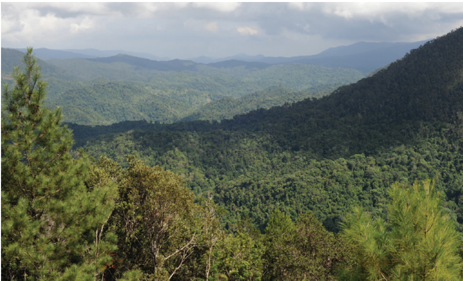
Parque Nacional Humboldt

Cuando Charles Darwin llegó a las Islas Galápagos hace casi 200 años, observó pequeñas aves llamadas pinzones. Los pinzones que vió eran todas especies diferentes. Notó que cada especie se había adaptado para comer diferentes tipos de comida. Darwin luego concluyó que los pinzones eran capaces de coexistir en la pequeña isla porque se habían adaptado de manera tal que les permitía dividir los recursos limitados, y en el proceso, se convirtieron en especies diferentes. Este fenómeno de diversificación de organismos donde hay competencia entre los miembros de la misma especie se documenta también en un grupo de lagartos llamados anolis. Muchas especies de lagartos, algunas endémicas de Cuba, residen en los bosques frondosos del Parque Nacional Humboldt de Cuba.