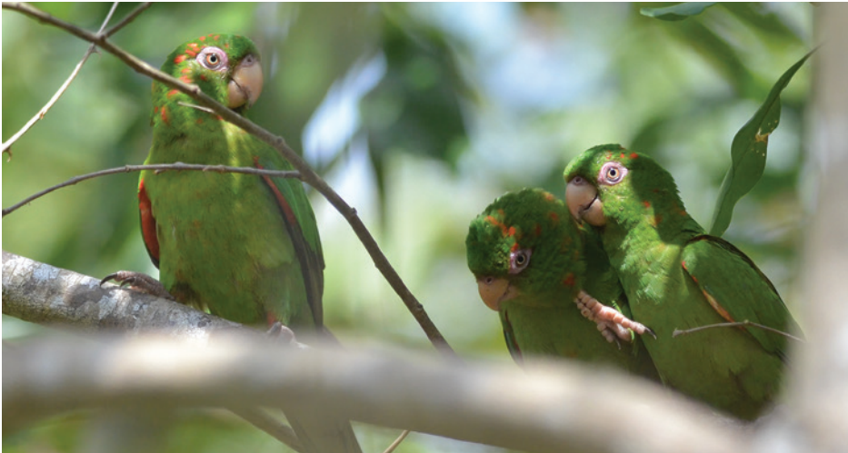
La mayor parte de los catey que existen hoy en Cuba viven en la Reserva de la Biosfera Ciénaga Zapata.

Esto hace que los esfuerzos de conservación sean todo un desafío. Cuba está relativamente aislada del continente y de las demás islas. Esto hace que muchos organismos tengan poblaciones de tamaño limitado y restringidas a áreas pequeñas. Por ejemplo, el catey, ( Psittacara euops ), una especie de periquito endémica de color verde brillante, se limita a la Reserva de la Biosfera Ciénaga Zapata. Debido a su pequeña población, esta ave puede ser profundamente afectada por amenazas ambientales como la pérdida del hábitat o la explotación del comercio de mascotas. Sólo quedan 5000 de estos periquitos en la actualidad.